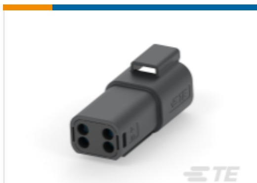
TE 产品编号1-2600030-0 4CCT BLACK RECEP W/LARGE SEAL