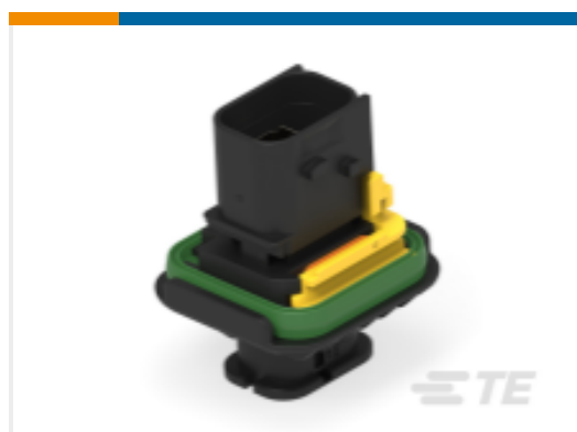
TE 产品编号9-2354248-1 HD MATEnet 1+2 TAB ASSY, GRP C, FLANGED