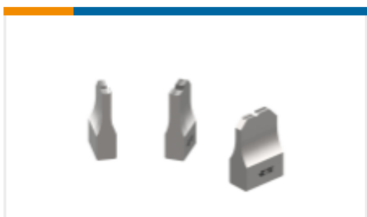
ANVIL REPRESENTATION ONLY TE 产品编号1803412-2 ANVIL, WIRE