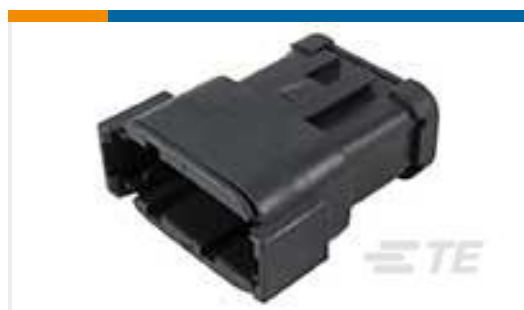
TE 产品编号DTMO4-12PA-E005 REC, 12P, BLK, N, CAP, A