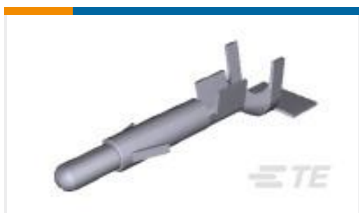
TE 产品编号350700-7 UMNL SPLIT PIN AU/NI/BR