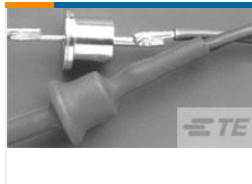
TE 产品编号5677894004 RNF-3000-39/13-9-SP