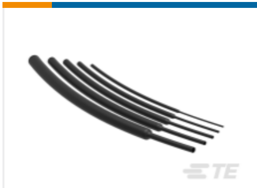
TE 产品编号5053192058 RNF-100-0 热缩管