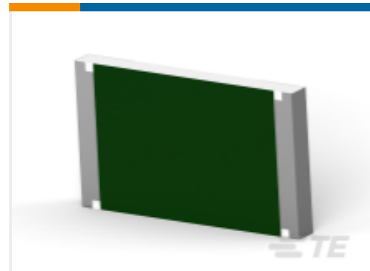
TE 产品编号8-2176407-8 3560 27R 5%