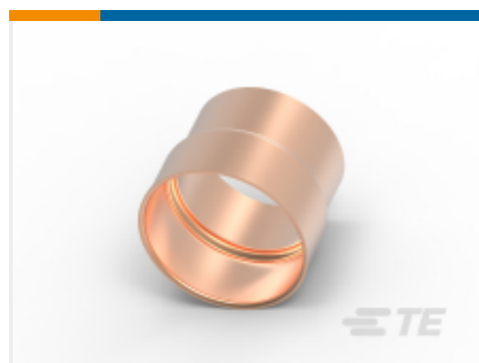
TE 产品编号9-2141157-1 SHIELD CRIMP FERRULE,90DEG