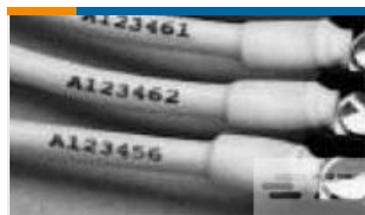
TE 产品编号5070054026 RNF-100-3/16-X-SP