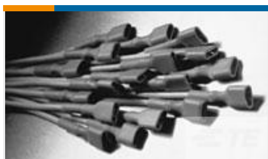
TE 产品编号9097614001 LSTT-4.8-0-SP