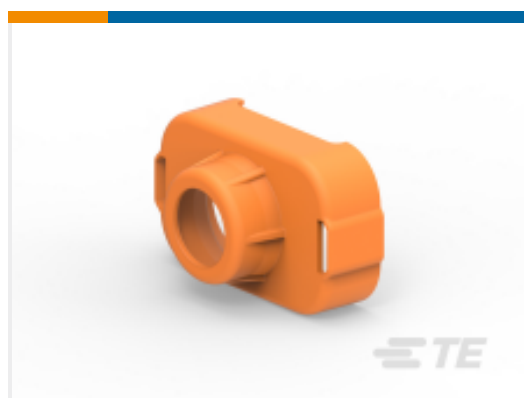
TE 产品编号2141614-5 COVER,CABLE SEAL