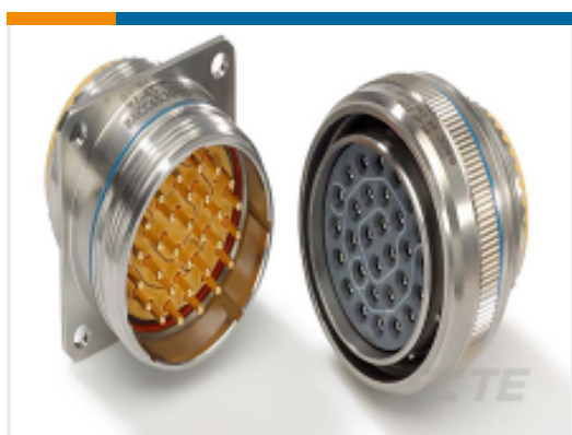
TE 产品编号ZPF000000000149375 983-0RS 14-07 PY