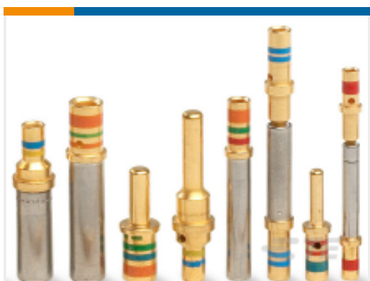
TE 产品编号ZPF000000000000363 006-0937-20