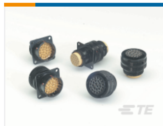
TE 产品编号ZPF00000000000018279 FDDBA 50-16-8 PN-K