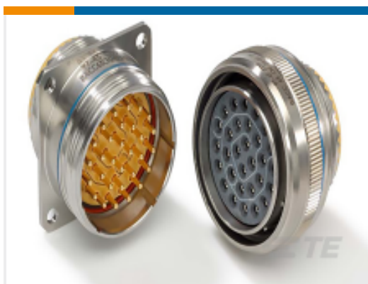
TE 产品编号ZPF0000000000007823 983-0Y 14-15 PN