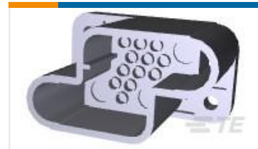
TE 产品编号213427-1 RECPT HSG, 3PWR, 12 SGNL, METRI