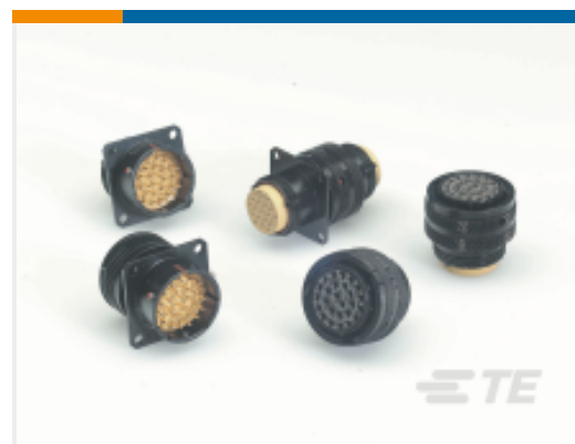
TE 产品编号ZPF00000000000018018 FDDBA 50-12-3 SN-K