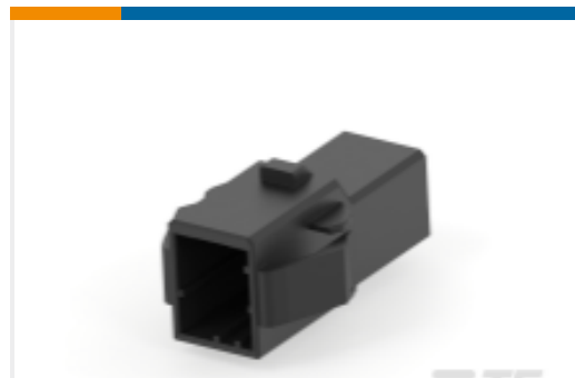
TE 产品编号2-1318115-4 Receptacle and Tab Housing: 2.5 mm Pitch, 250V