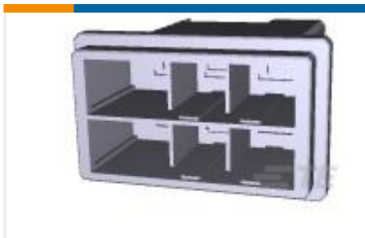
TE 产品编号2-917808-3 DYNAMIC D-5200M TAB HSG 6P Y-Y