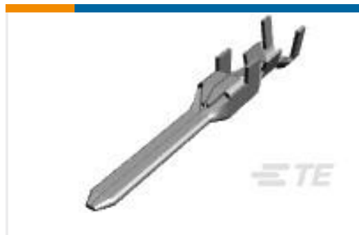
TE 产品编号175285-5 DYNAMIC D-3 TAB CONT. M PRE-TIN