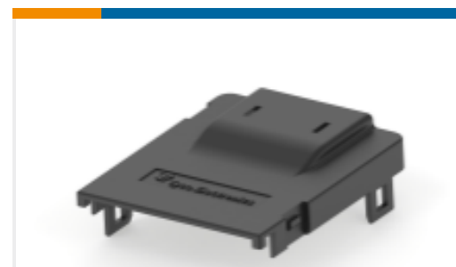
TE 产品编号1986186-1 Strain Relief,20 Posn,D3000 Dynamic, 2