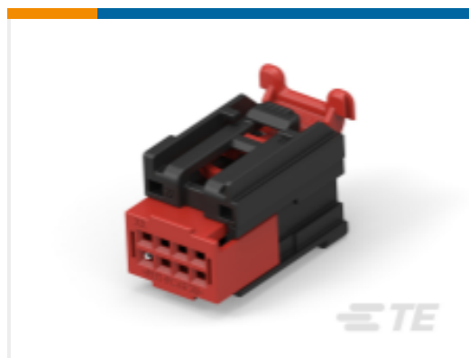
TE 产品编号1456987-1 2x4 Fem unsealed LP assy Key A