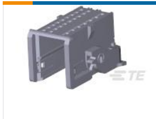
TE 产品编号1-1718484-4 CARRIER FOR RECEPTACLE INSERTS