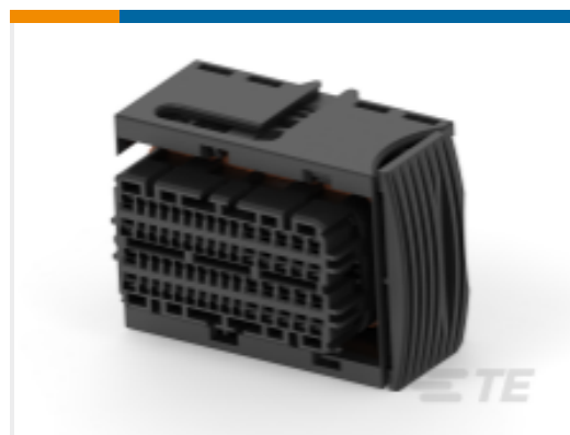
TE 产品编号2208277-3 60POS MQS REC SEALED