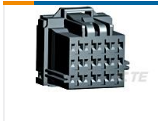
TE 产品编号4-968972-1 MCP2,8 GEH ASSY 12P