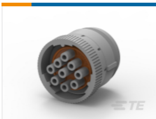
TE 产品编号HD16-9-96SE PLUG ASM