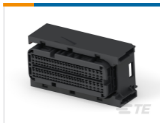
TE 产品编号8-1564284-5 96POS, MCON-1.2 CB, REC HSG, ASSY