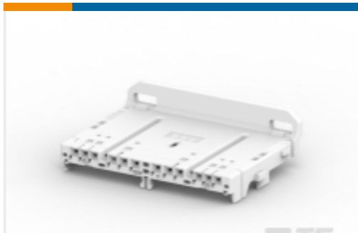
TE 产品编号1903611-6 0.50 SERIES CONN 12POS PLUG HOUSING ASSY