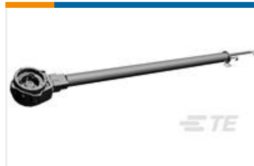
TE 产品编号1746234-3 XENON HEADLAMP HARNESS ASSY