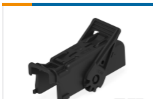
TE 产品编号2141969-1 COVER, WITH LEVER,ASSY