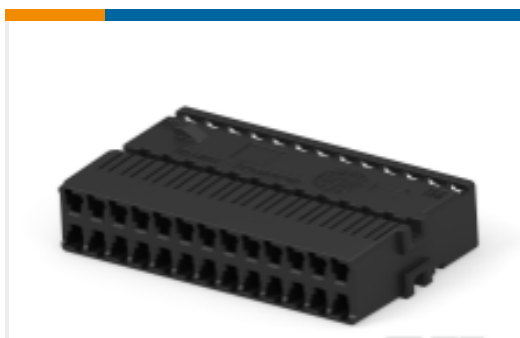
TE 产品编号1924136-4 Carrier, 26P GenerationY, Hand Mate Conn