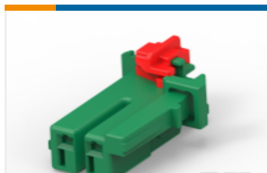
TE 产品编号2356394-3 2POS, MCON 1.2 CB REC 2p TL UNSEALED