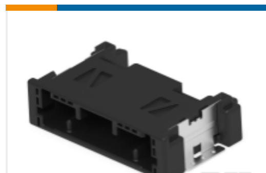
TE 产品编号2367111-2 0.50 SMT TYPE CAP ASSEMBLY 16POS