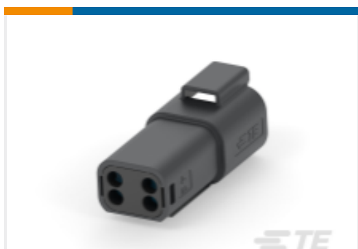
TE 产品编号1-2600030-0 4CCT BLACK RECFP W/LARGE SEAL