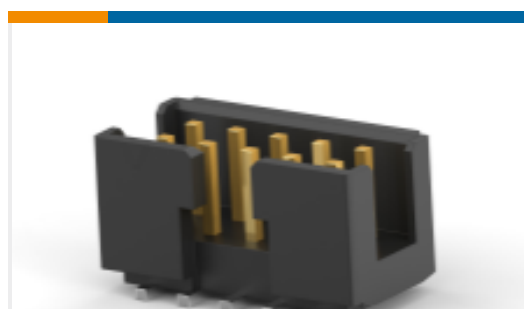
TE 产品编号1-2373376-0 10P,2MM,SHRD HDR,DRVT,SMD,0.1 AU,TB