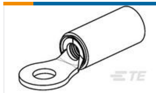
TE 产品编号1577646-1 TERMINAL RT PIDG PEEK STRATO 10 AWG