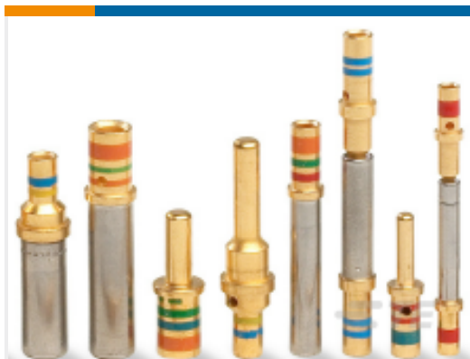
TE 产品编号ZPF00000000000571 020-0511-22