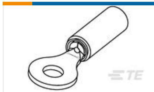
TE 产品编号1577618-1 TERMINAL RT PIDG PEEK STRATO 24-22 AWG