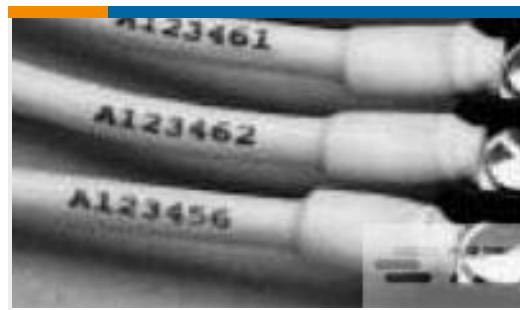
TE 产品编号5053002017 RNF-100-1/8-2-STK