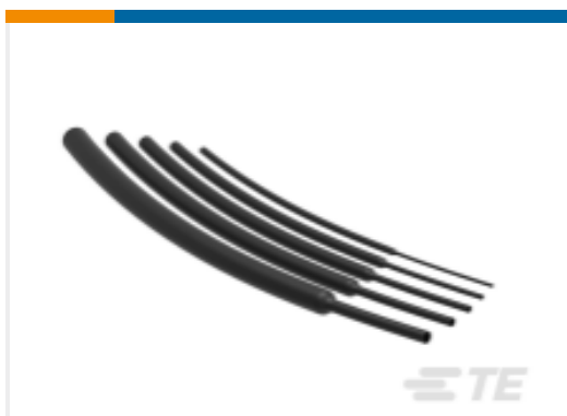
TE 产品编号NB17932001 RNF-100-1-1/2-BK-STK