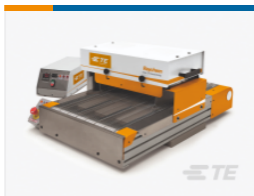
TE 产品编号 955018-000 CLTEQ-M105-TUNNEL-OVEN