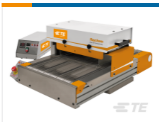
TE 产品编号 2326489-1 MODEL 105 TUNNEL OVEN, 36" ENTRY, STAND