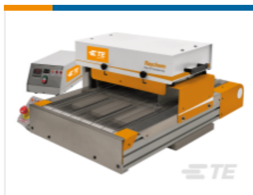
TE 产品编号 2394980-1 MOD 105 TUN OVEN, 69" ENTRY, STARDARD