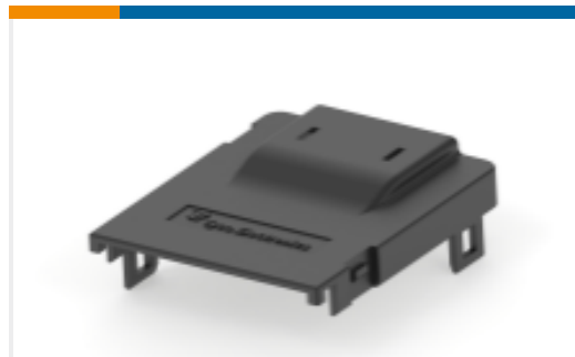
TE 产品编号1986186-1 Strain Relief,20 Posn,D3000 Dynamic, 2