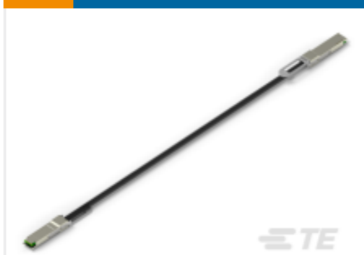
TE 产品编号2333393-7 QSFP 25GIG 30AWG 3 METER