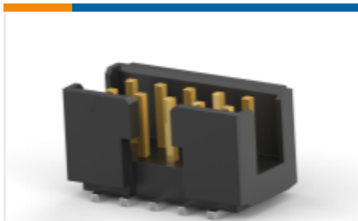
TE 产品编号1-2373376-0 10P,2MM,SHRD HDR,DRV,T,SMD,0.1 AU,TB