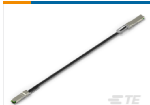
TE 产品编号2333393-7 QSFP 25GIG 30AWG 3 METER