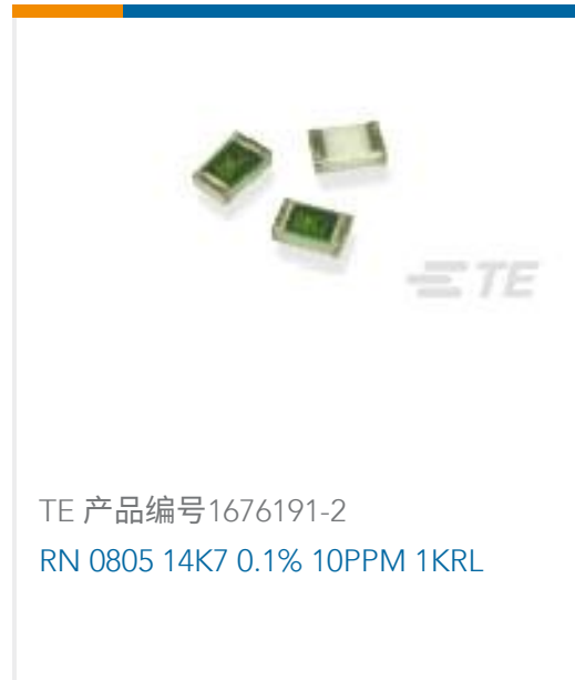
TE 产品编号1676191-2 RN 0805 14K7 0.1% 10PPM 1KRL