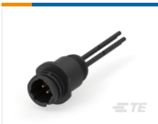
TE 产品编号2386899-2 HNG RCPT CONN CA,STD,SER 1,SZ 11-4,1.0 M