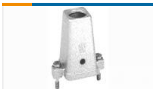
TE 产品编号4-1102700-5 EMV-K.3/4.STO.1.11.G