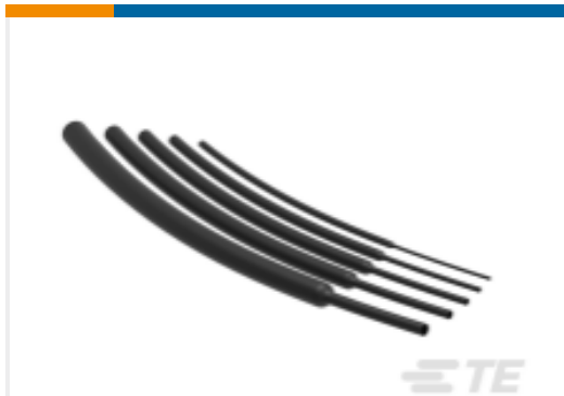
TE 产品编号5052842031 RNF-100-0 热缩管