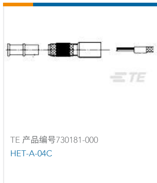
TE 产品编号730181-000 HET-A-04C