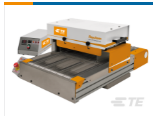
TE 产品编号 2394980-1 MOD 105 TUN OVEN, 69" ENTRY, STANDARD