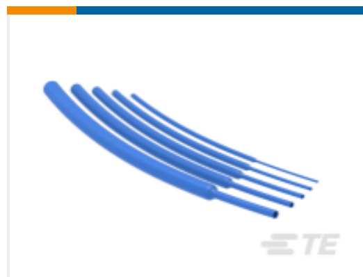
TE 产品编号NB13582001 RNF-100-3/8-BU-STK