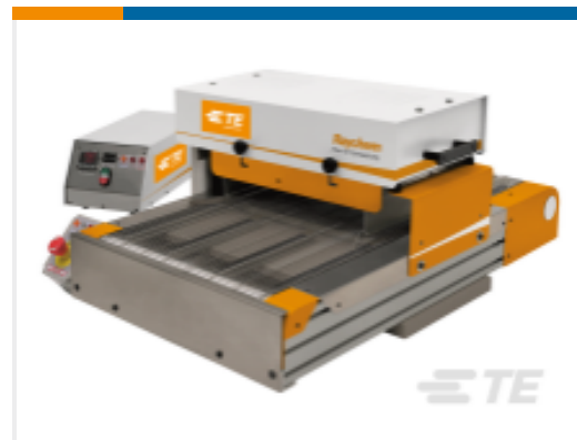
TE 产品编号 2394980-1 MOD 105 TUN OVEN, 69" ENTRY, STANDARD