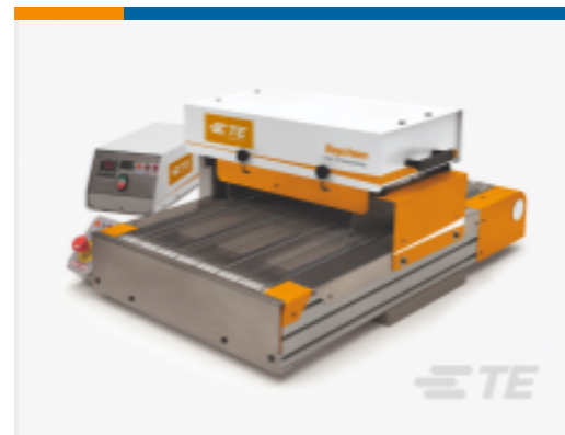
TE 产品编号 955018-000 CLTEQ-M105-TUNNEL-OVEN