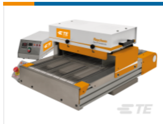
TE 产品编号 2326489-1 MODEL 105 TUNNEL OVEN, 36" ENTRY, STAND