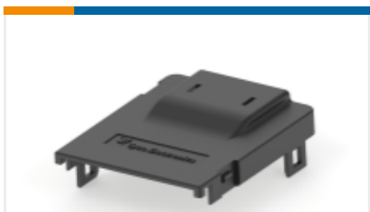
TE 产品编号1986186-1 Strain Relief,20 Posn,D3000 Dynamic, 2