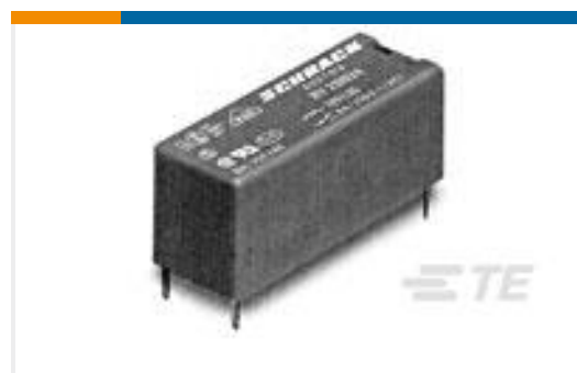
TE 产品编号2-1393225-1 RY611024