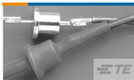
TE 产品编号5677964005 RNF-3000-39/13-X-SP