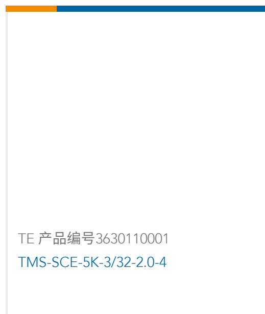
TE 产品编号3630110001 TMS-SCE-5K-3/32-2.0-4