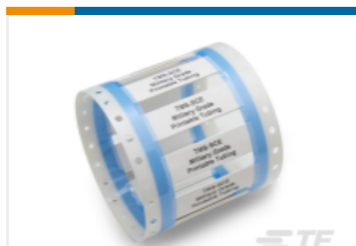
TE 产品编号3279370001 TMS-SCE Military Grade Sleeves