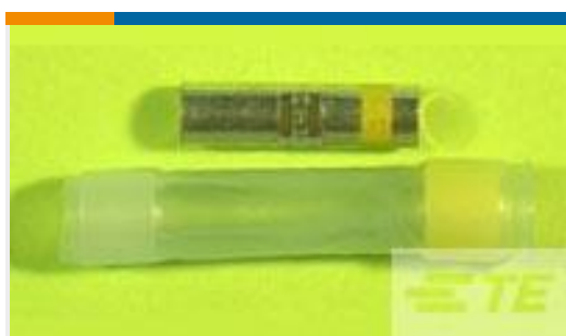
TE 产品编号695051-000 W-096-02