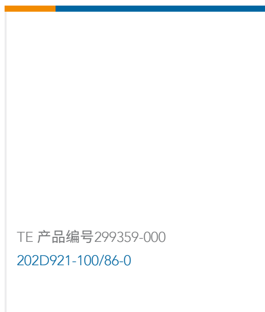
TE 产品编号299359-000 202D921-100/86-0