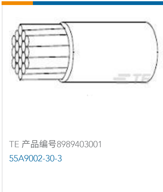
TE 产品编号8989403001 55A9002-30-3