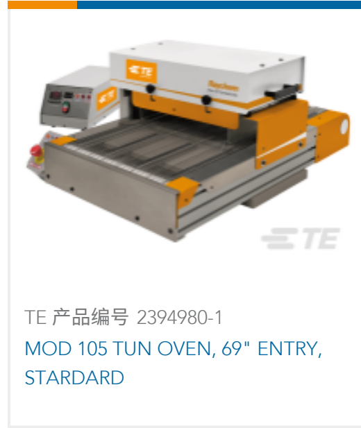
TE 产品编号 2394980-1 MOD 105 TUN OVEN, 69" ENTRY, STANDARD