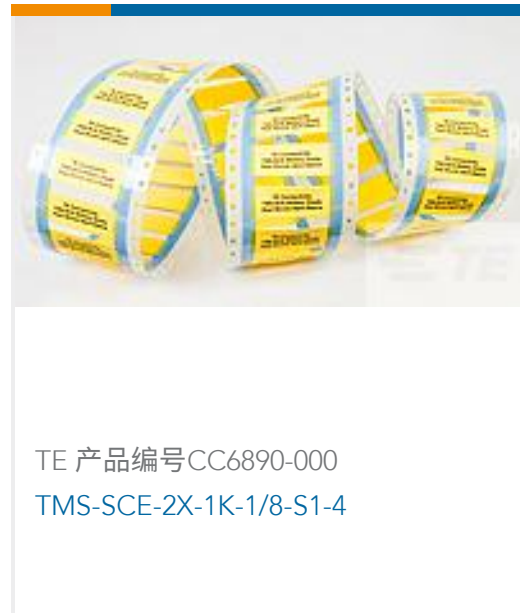
TE 产品编号CC6890-000 TMS-SCE-2X-1K-1/8-S1-4