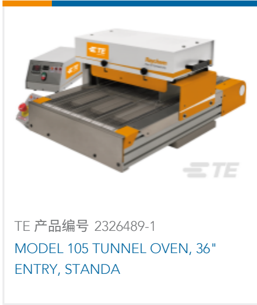
TE 产品编号 2326489-1 MODEL 105 TUNNEL OVEN, 36" ENTRY, STAND