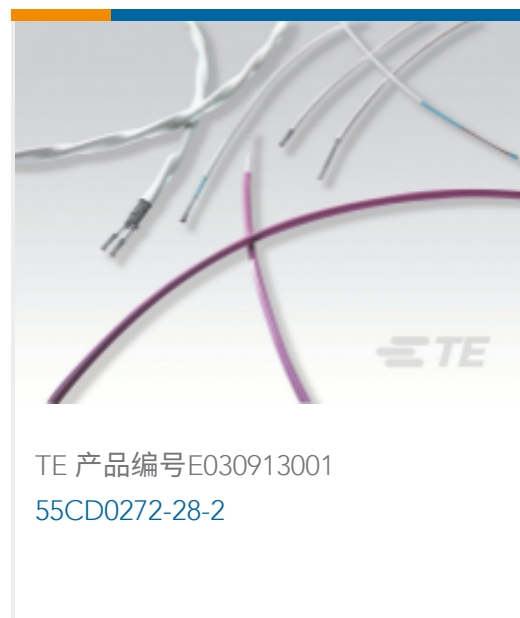
TE 产品编号E030913001 55CD0272-28-2