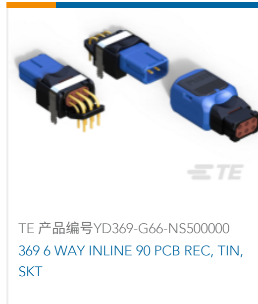
TE 产品编号YD369-G66-NS500000 369 6 WAY INLINE 90 PCB REC, TIN, SKT