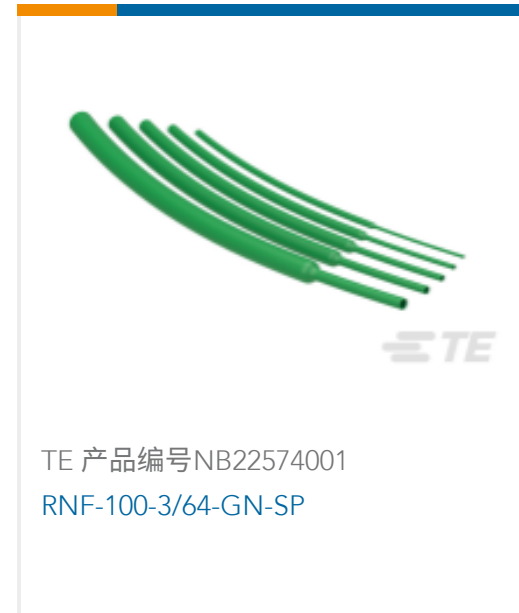
TE 产品编号NB22574001 RNF-100-3/64-GN-SP