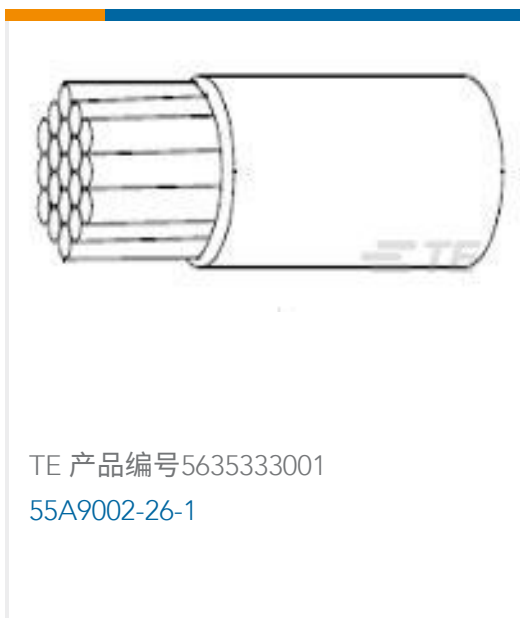
TE 产品编号5635333001 55A9002-26-1