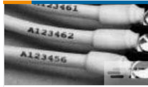
TE 产品编号EG0543-000 RNF-100-3/64-VT-STK