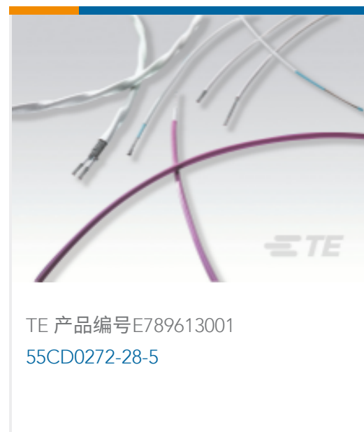
TE 产品编号E789613001 55CD0272-28-5