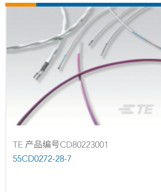
TE 产品编号CD80223001 55CD0272-28-7