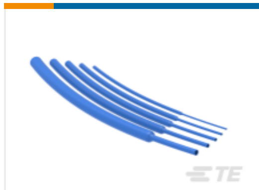
TE 产品编号NB15604001 RNF-100-BU 热缩管