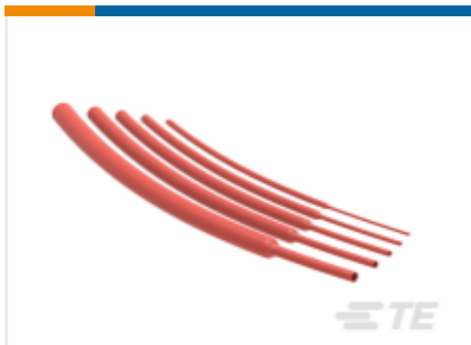
TE 产品编号NB15554001 RNF-100-3/64-RD-SP