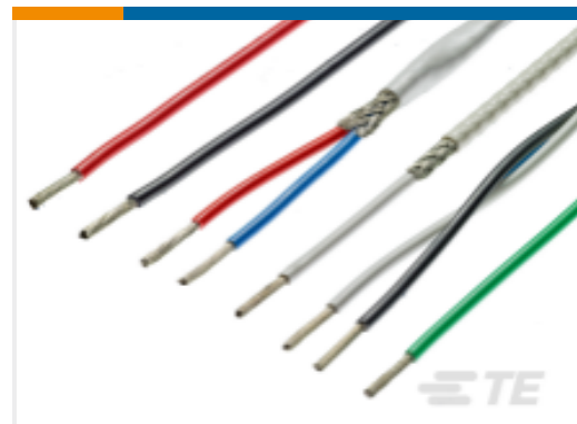
TE 产品编号EG7214-000 44A0121-22-9/958