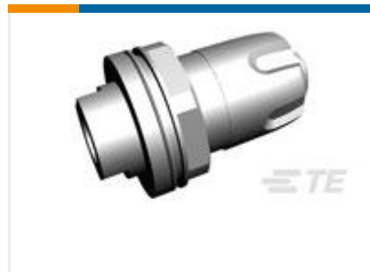
TE 产品编号1693741-1 CONN SHELL KIT, D-HOLE BULKHD, HA