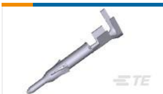
TE 产品编号170364-1 MINI UNIVERSAL M-N-L PIN LP