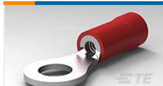
TE 产品编号34148 PG R 22-16 COMM 22-18 MIL 8