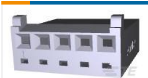
TE 产品编号1375820-5 CST-100 II HOUSING 5 POS