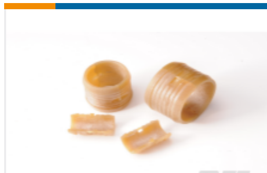
TE 产品编号AAE3173-00 BND-SR-08