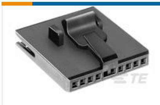
TE 产品编号487545-2 005 HOUSING FFC RCPT 050CL SR