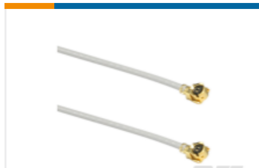
TE 产品编号CSI-UFFR-200-UFFR U.FL/MHF1 to U.FL/MHF1 200mm 1.13 OD