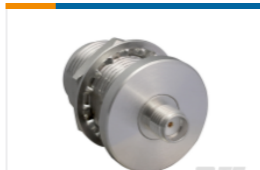
TE 产品编号ADP-SMAF-NF-B-W SMA Jack to N Jack