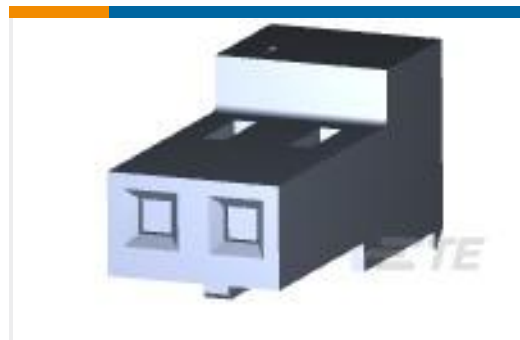
TE 产品编号3-640434-2 02P MTA156 CONN ASSY 24AWG WHT