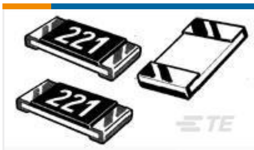
TE 产品编号2176230-2 3522 1R0 5% 3W