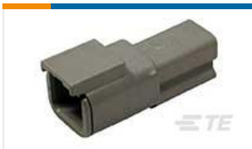
TE 产品编号DTM04-2P REC, 2P, GRY, N