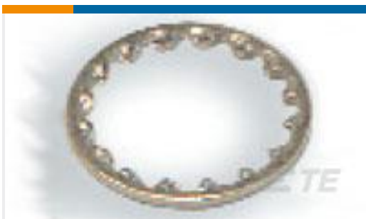
TE 产品编号1-1634817-0 BNC / TNC Lockwasher