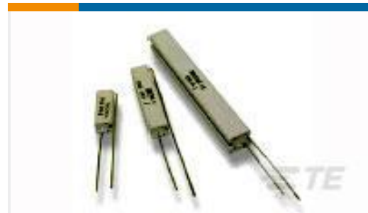
TE 产品编号1-1623730-6 BCHE 4 W 3K3 5%