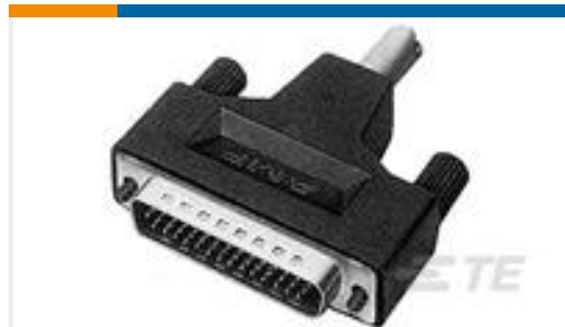
TE 产品编号1658678-1 KIT,HDP-22,ENCLSUR,PLUG,SIZE 1