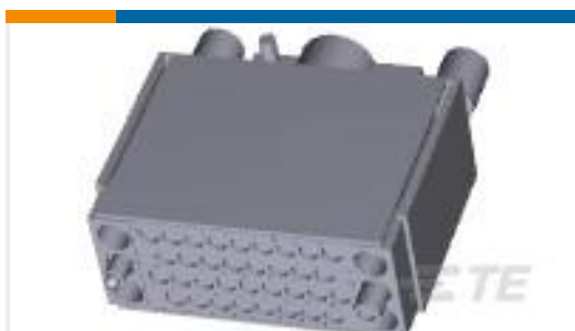
TE 产品编号213522-1 M-SERIES KIT 34P V.35