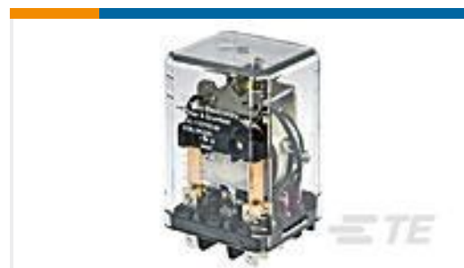
TE 产品编号3-1393115-3 KUL-11D15D-48=KU