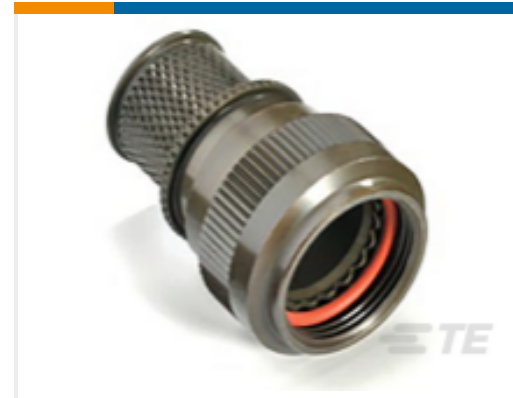
TE 产品编号BTH1-17-06-1-ZN BTH1-17-06-1-ZN