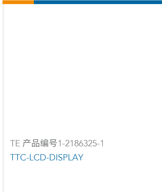
TE 产品编号1-2186325-1 TTC-LCD-DISPLAY