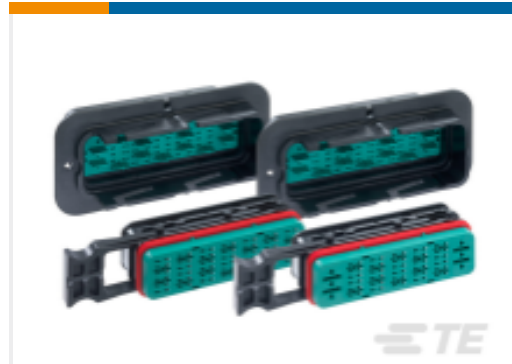
TE 产品编号2500012-1 SRC2 Female 60+6AG Mixed Power, Green