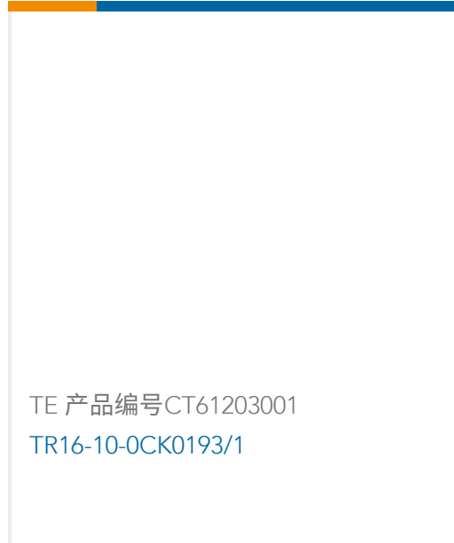
TE 产品编号CT61203001 TR16-10-OCK0193/1