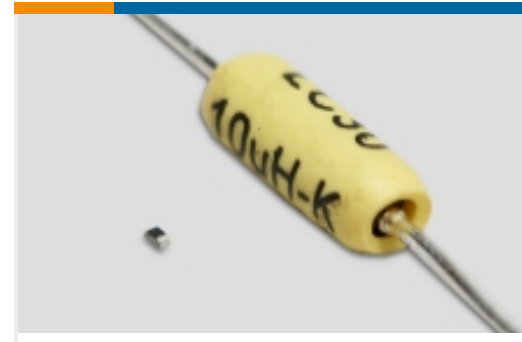
高频和射频电感器(82)