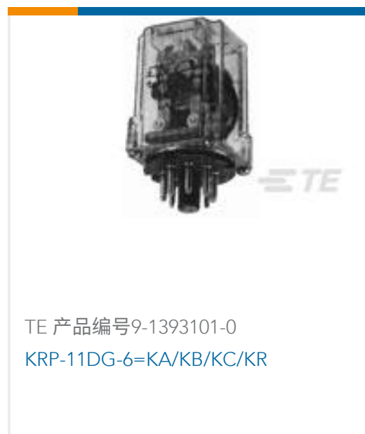
TE 产品编号9-1393101-0 KRP-11DG-6=KA/KB/KC/KR