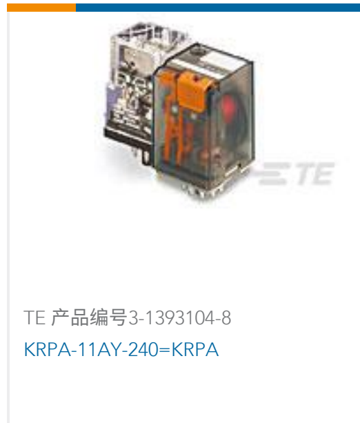
TE 产品编号3-1393104-8 KRPA-11AY-240=KRPA