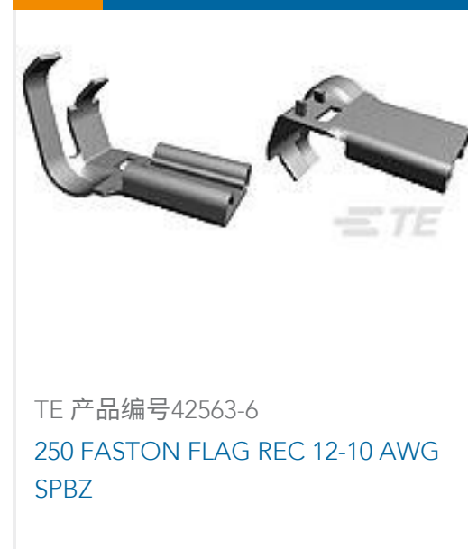
TE 产品编号42563-6 250 FASTON FLAG REC 12-10 AWG SPBZ