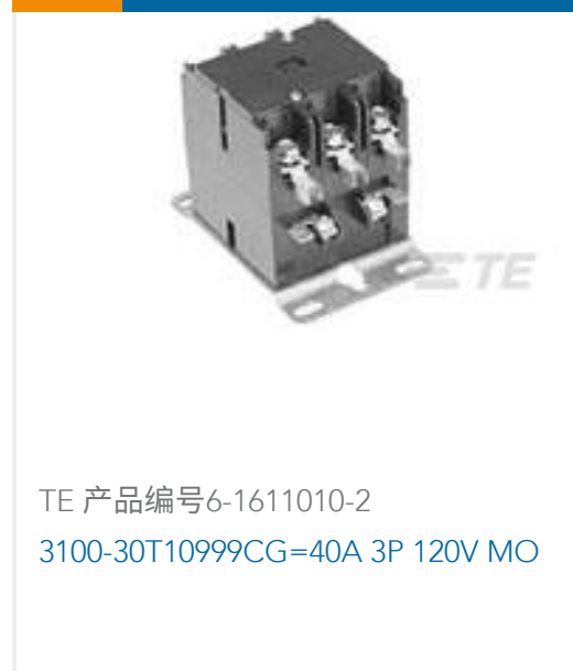
TE 产品编号6-1611010-2 3100-30T10999CG=40A 3P 120V MO