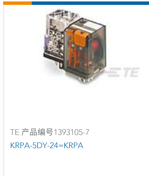
TE 产品编号1393105-7 KRPA-5DY-24=KRPA