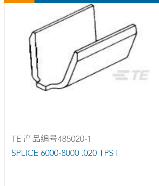
TE 产品编号485020-1 SPLICE 6000-8000 .020 TPST