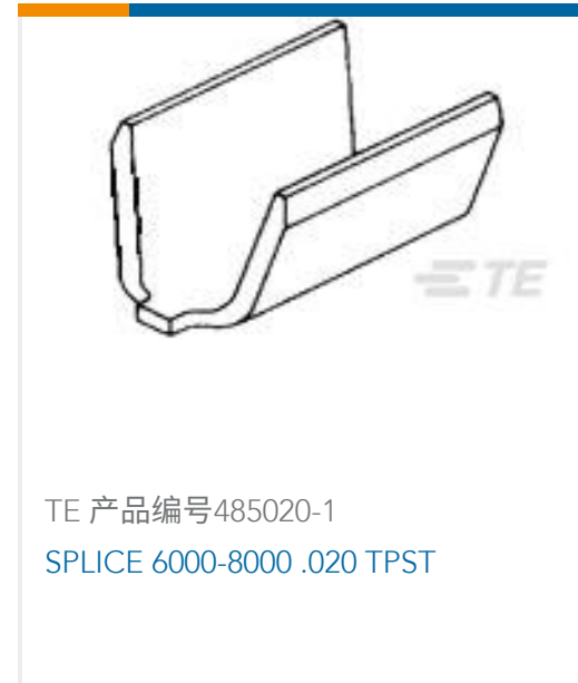
TE 产品编号485020-1 SPLICE 6000-8000 .020 TPST