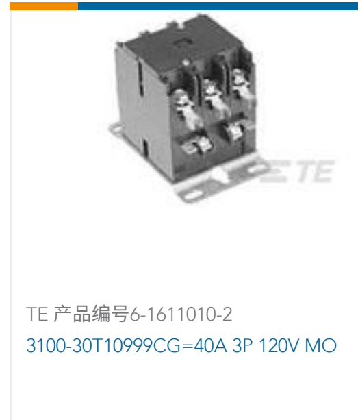
TE 产品编号6-1611010-2 3100-30T10999CG=40A 3P 120V MO