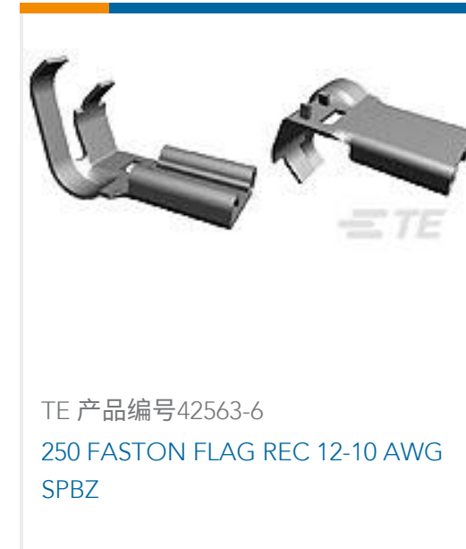
TE 产品编号42563-6 250 FASTON FLAG REC 12-10 AWG SPBZ