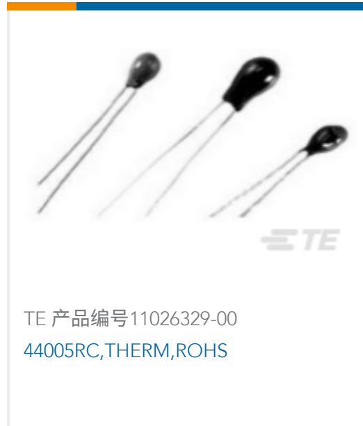
TE 产品编号11026329-00 44005RC,THERM,ROHS