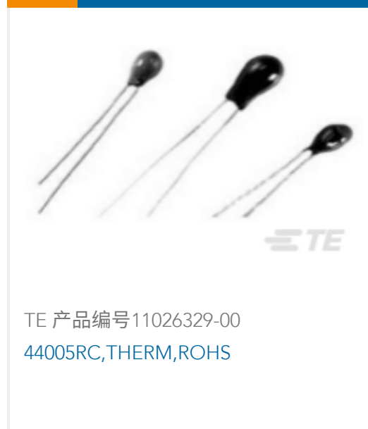
TE 产品编号11026329-00 44005RC, THERM, ROHS