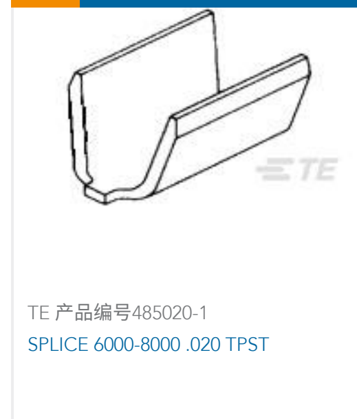
TE 产品编号485020-1 SPLICE 6000-8000 .020 TPST