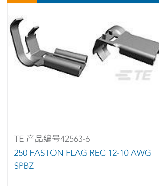
TE 产品编号42563-6 250 FASTON FLAG REC 12-10 AWG SPBZ