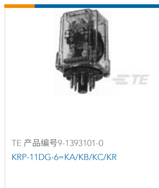
TE 产品编号9-1393101-0 KRP-11DG-6=KA/KB/KC/KR