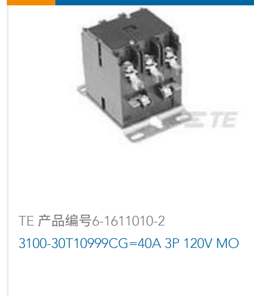
TE 产品编号6-1611010-2 3100-30T10999CG=40A 3P 120V MO