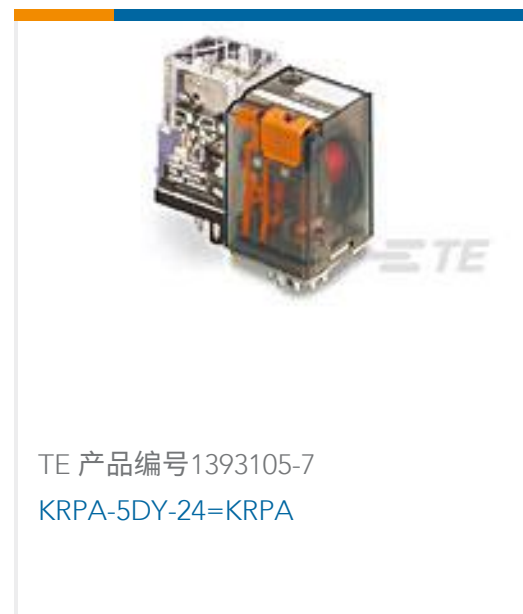
TE 产品编号1393105-7 KRPA-5DY-24=KRPA