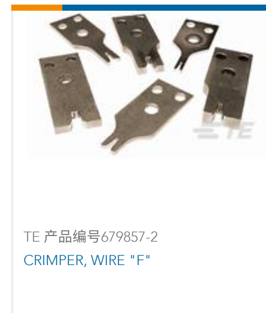
TE 产品编号679857-2 CRIMPER, WIRE "F"