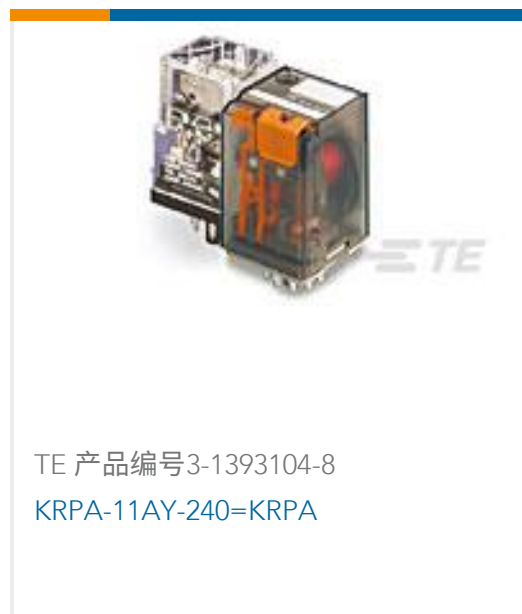
TE 产品编号3-1393104-8 KRPA-11AY-240=KRPA