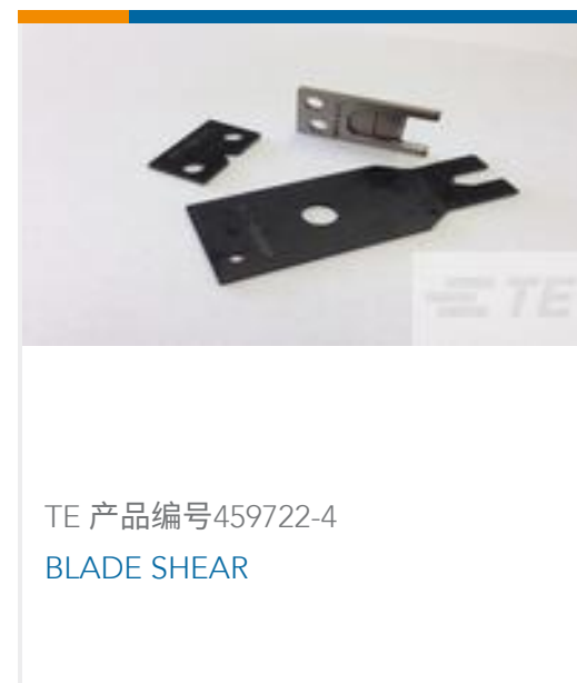
TE 产品编号459722-4 BLADE SHEAR