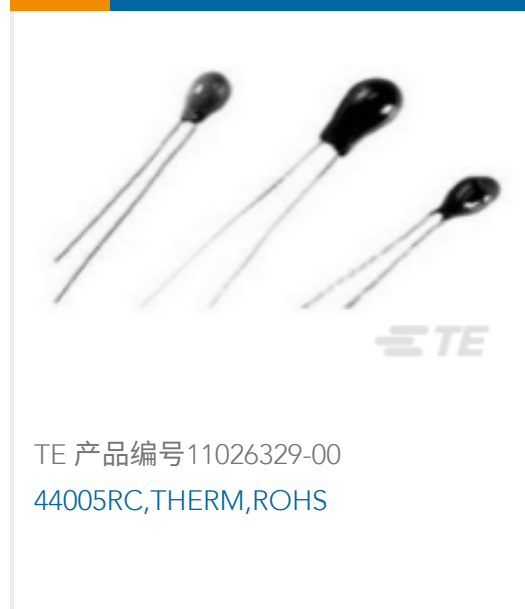
TE 产品编号11026329-00 44005RC,THERM,ROHS