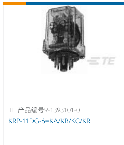
TE 产品编号9-1393101-0 KRP-11DG-6=KA/KB/KC/KR