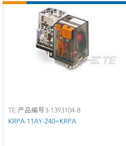
TE 产品编号3-1393104-8 KRPA-11AY-240=KRPA