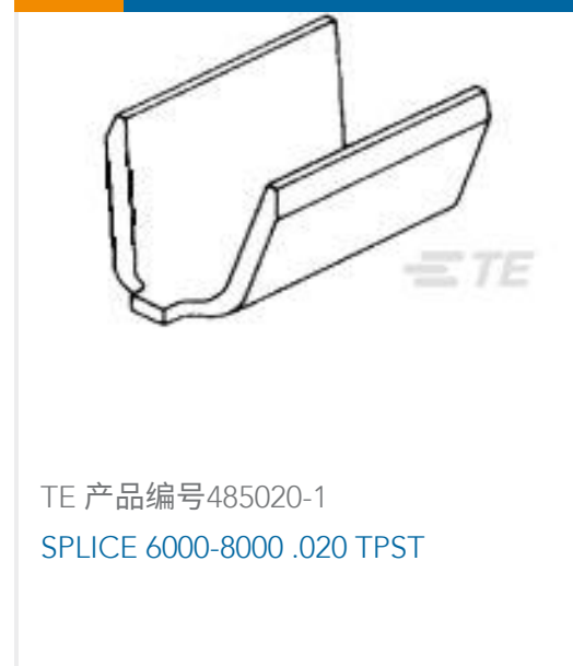
TE 产品编号485020-1 SPLICE 6000-8000 .020 TPST