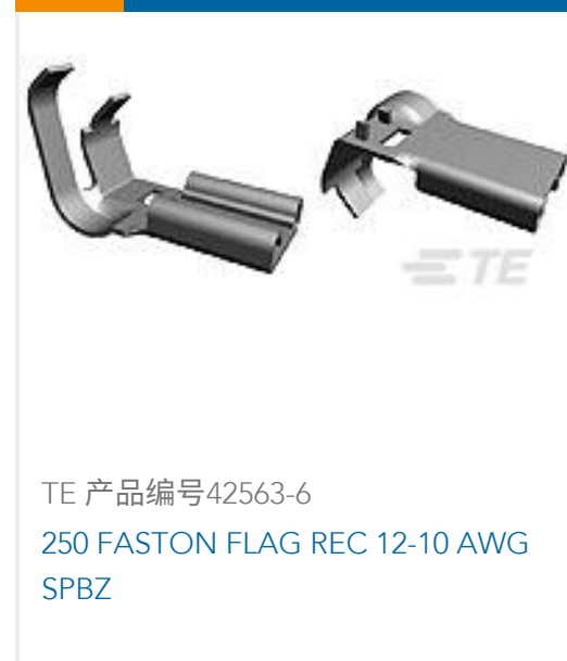
TE 产品编号42563-6 250 FASTON FLAG REC 12-10 AWG SPBZ