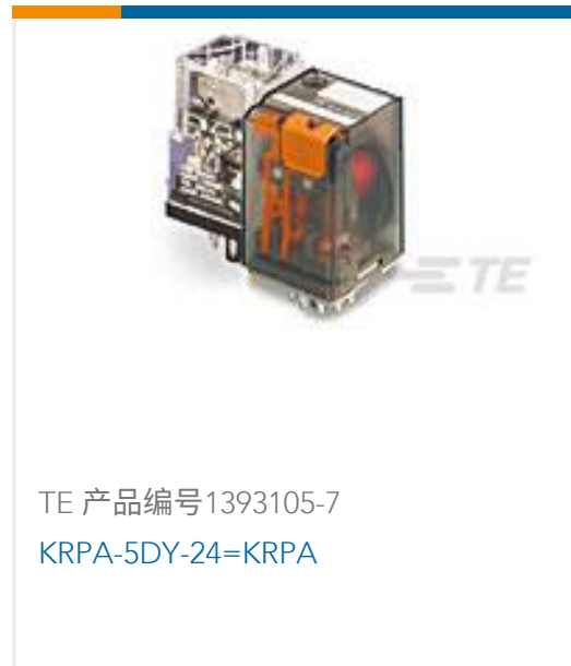
TE 产品编号1393105-7 KRPA-5DY-24=KRPA