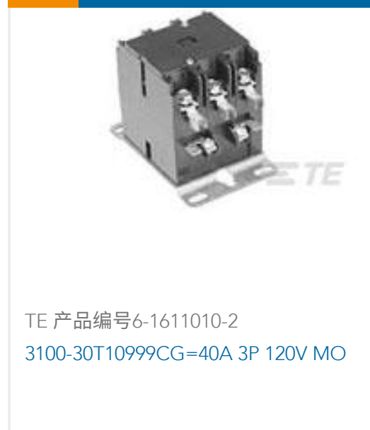
TE 产品编号6-1611010-2 3100-30T10999CG=40A 3P 120V MO