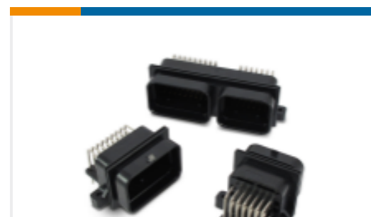
TE 产品编号6437288-2 Superseal 连接器接头 : 1.0 mm