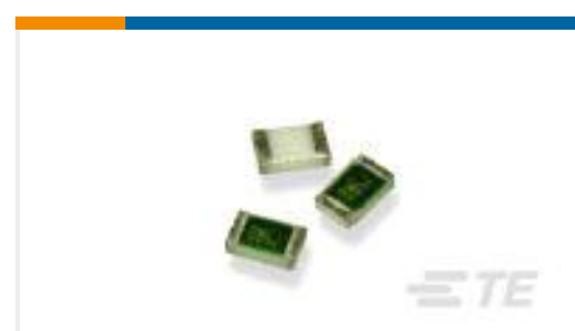
TE 产品编号1614883-1 CPF0805 100K 0.1% 25PPM 5K RL