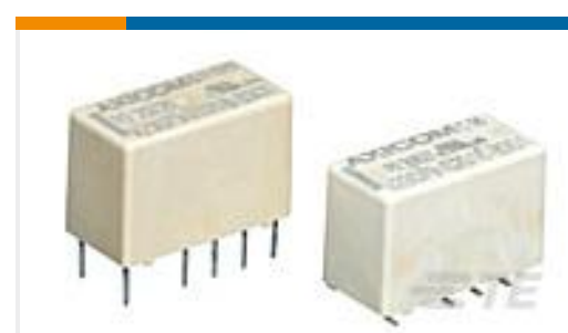
TE 产品编号3-1393788-6 V23079B1203B301