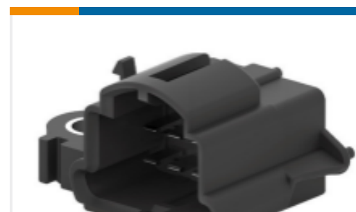
TE 产品编号963357-3 Low & Medium Power Header