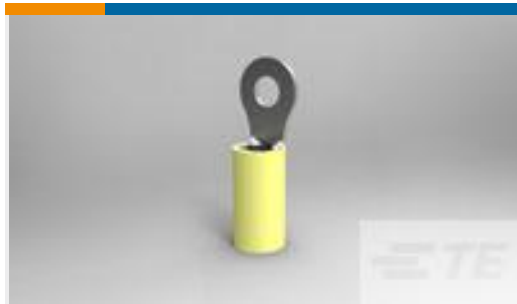
TE 产品编号2-320568-2 TERM, RT, PIDG IR, 12, #8