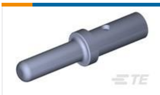
TE 产品编号2-592404-1 5000-027-0020