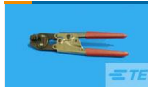
TE 产品编号994855-000 AD-1377-103-CRIMP-LOCATOR