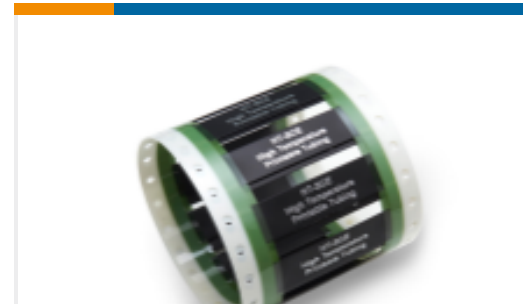
TE 产品编号8947570001 HT-SCE High Temperature Sleeves