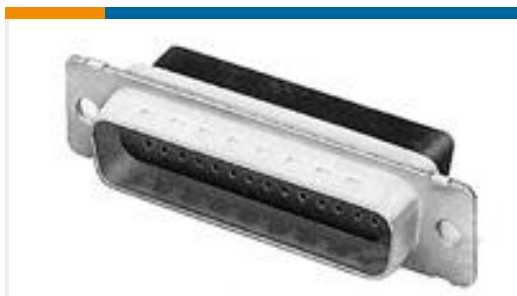
TE 产品编号1658691-1 HDP-22,PLUG,SIZE 1,15 POSN,CLI