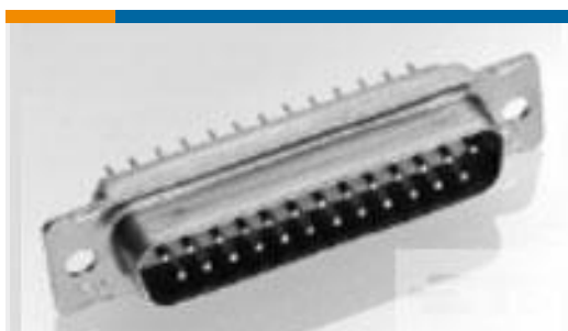
TE 产品编号1-1757819-0 AMPLIMITE,ASY,PLUG,STD,109,ZN,5,CT