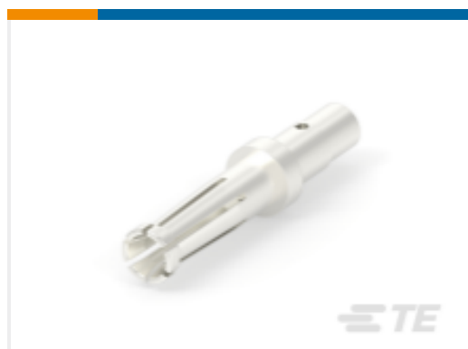
TE 产品编号2390328-1 Socket, Contact, 3,6 Dia BOT