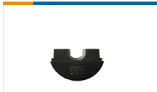
TE 产品编号1-1490413-1 HYP10 SOLIS HD 4AWG NEST