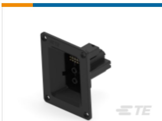
TE 产品编号2399991-1 KIT, 2P RECPT DOCKING, BOT