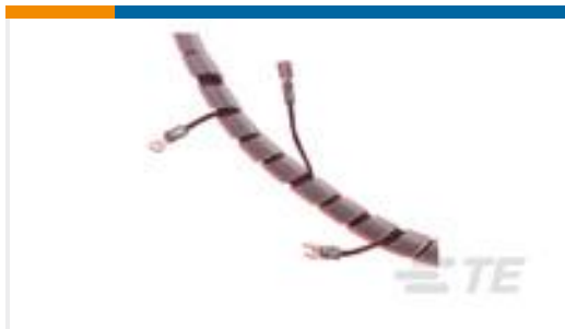
TE 产品编号500013-1 SPIRAP, 1/8" NYLON, NAT, 50 FT