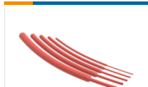
TE 产品编号NB20074001 VERSAFIT-1/4-2-SP