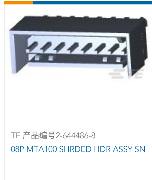
TE 产品编号2-644486-8 08P MTA100 SHRDED HDR ASSY SN