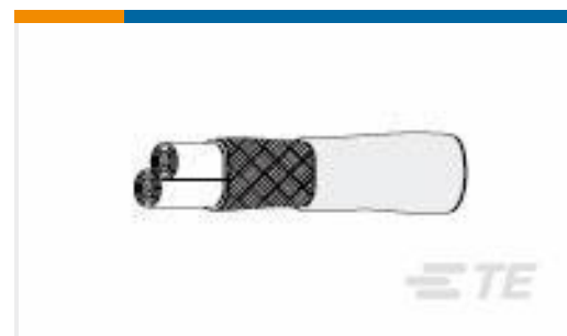
TE 产品编号306017-001 44AM1121-16-0/9-9