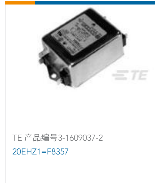
TE 产品编号3-1609037-2 20EHZ1=F8357