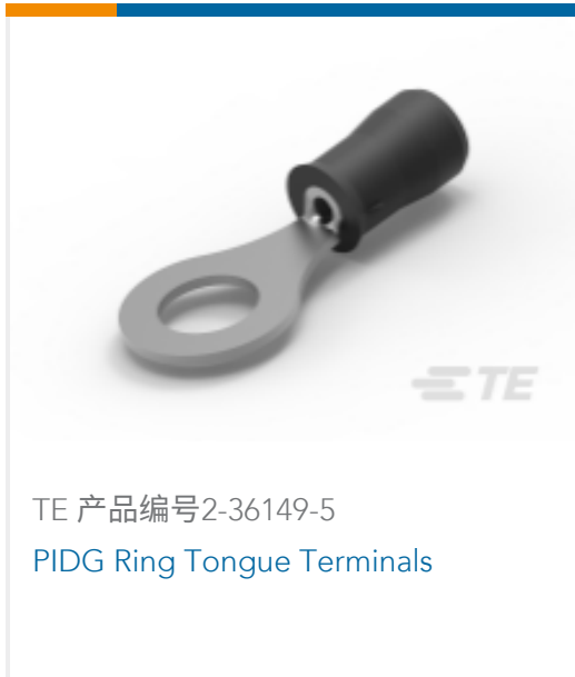
TE 产品编号2-36149-5 PIDG Ring Tongue Terminals