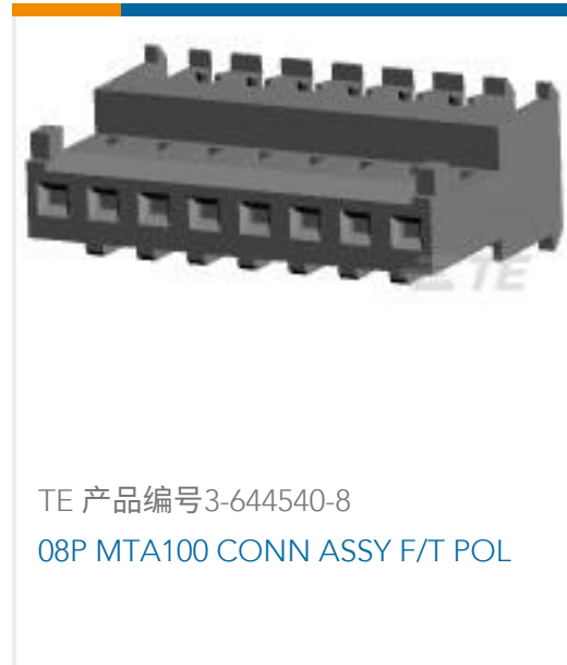
TE 产品编号3-644540-8 08P MTA100 CONN ASSY F/T POL