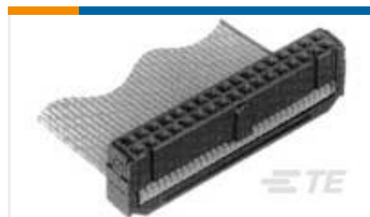
TE 产品编号1-1658528-1 636-1030LF=FEM SKT BLADE POL 1