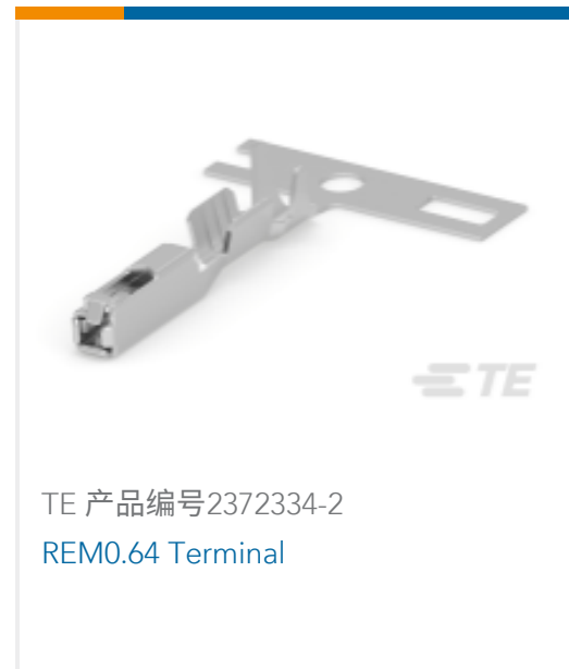
TE 产品编号2372334-2 REM0.64 Terminal