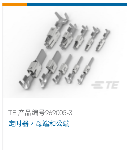
TE 产品编号969005-3 定时器，母端和公端