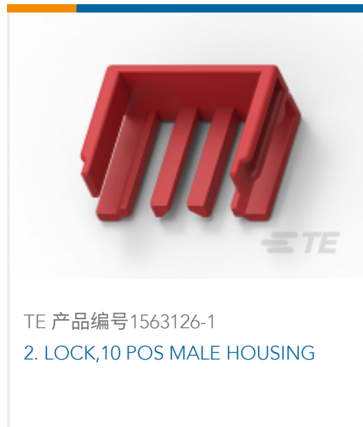
TE 产品编号1563126-1 2. LOCK,10 POS MALE HOUSING