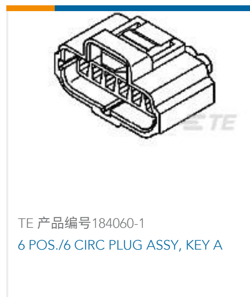
TE 产品编号184060-1 6 POS./6 CIRC PLUG ASSY, KEY A