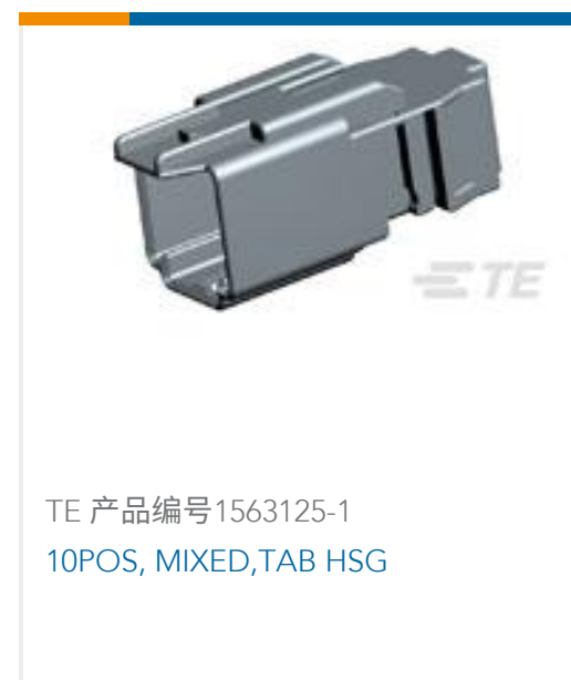
TE 产品编号1563125-1 10POS, MIXED,TAB HSG