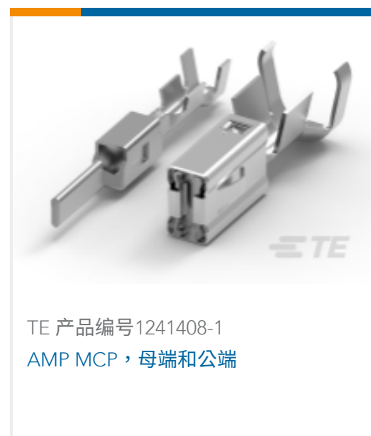
TE 产品编号1241408-1 AMP MCP，母端和公端