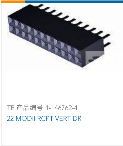
TE 产品编号 1-146762-4 22 MODII RCPT VERT DR