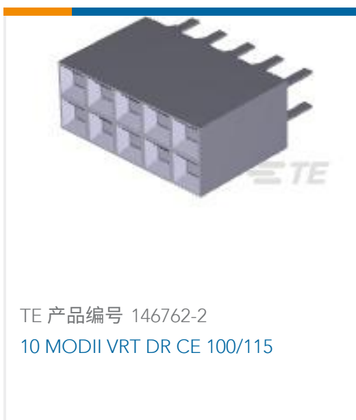
TE 产品编号 146762-2 10 MODII VRT DR CE 100/115