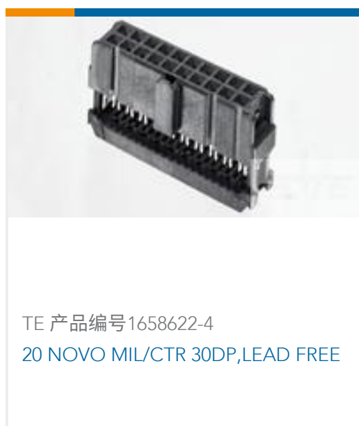
TE 产品编号1658622-4 20 NOVO MIL/CTR 30DP, LEAD FREE