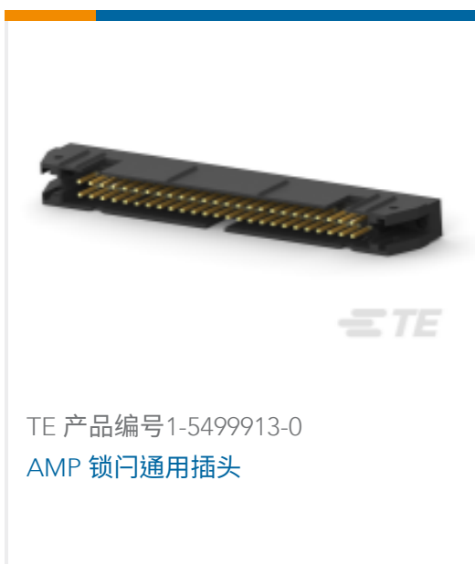
TE 产品编号1-5499913-0 AMP 锁门通用插头