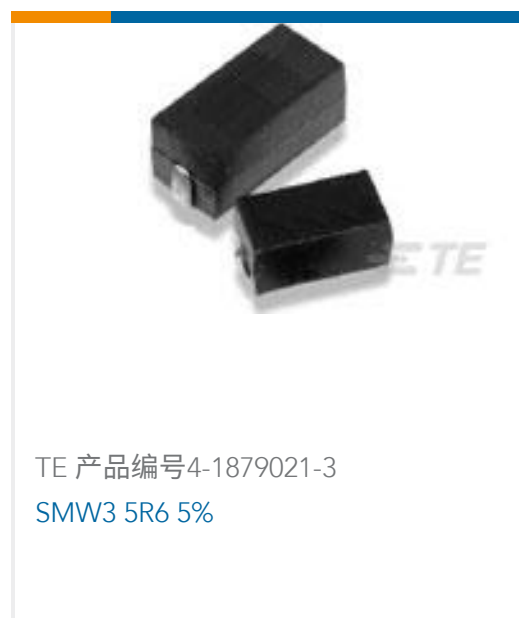
TE 产品编号4-1879021-3 SMW3 5R6 5%