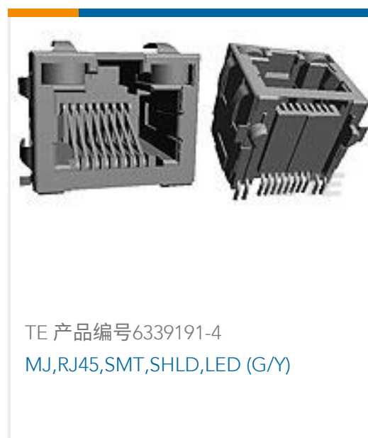
TE 产品编号6339191-4 MJ, RJ45, SMT, SHLD, LED (G/Y)