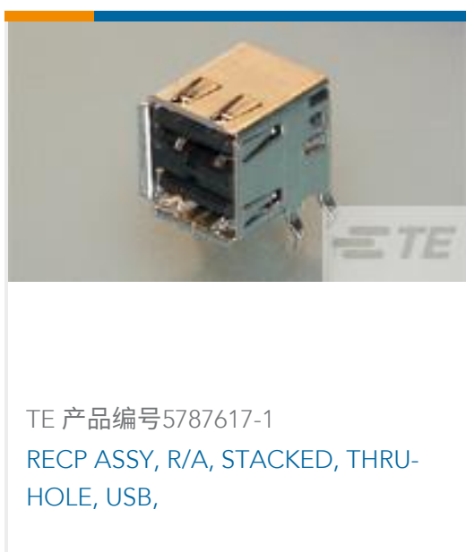
TE 产品编号5787617-1 RECP ASSY, R/A, STACKED, THRU-HOLE, USB,