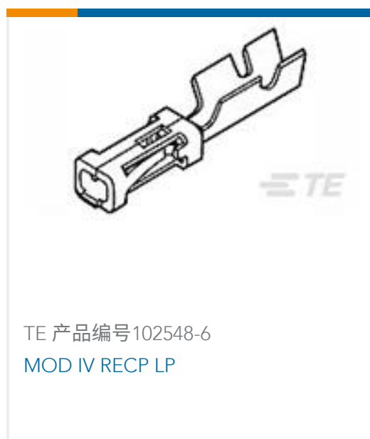
TE 产品编号102548-6 MOD IV RECP LP