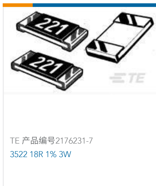
TE 产品编号2176231-7 3522 18R 1% 3W