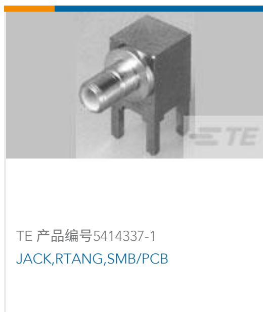
TE 产品编号5414337-1 JACK, RTANG, SMB/PCB