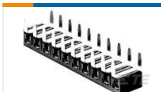
TE 产品编号 87987-8 08 MODI BDMNT RCPT SR .156CL