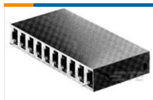
TE 产品编号87159-8 08 MODI CRMP S-I HSG SR .156CL