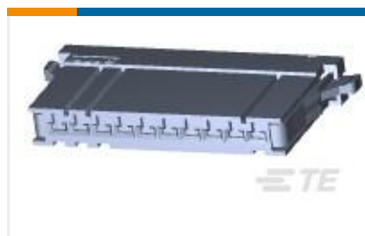
TE 产品编号1-178288-8 DYNAMIC 3100 REC HSG 10P