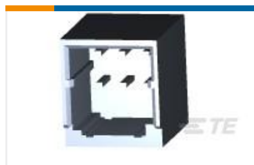
TE 产品编号1-1827875-3 DYNAMIC 1200D HDR ASSY V 6P X BLACK GOLD