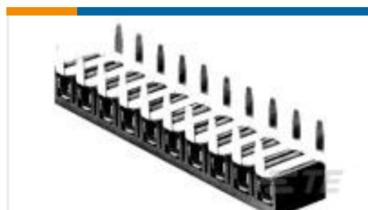
TE 产品编号 87987-5 05 MODI BDMNT RCPT SR .156CL