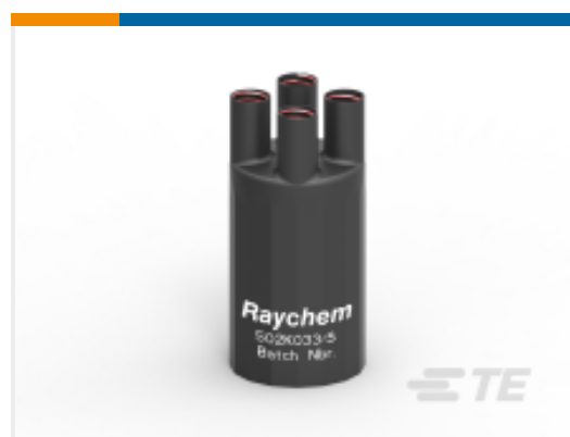
TE 产品编号E00553N001 502K033/S(S15)