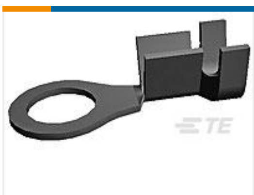
TE 产品编号170225-1 RING TERMINAL