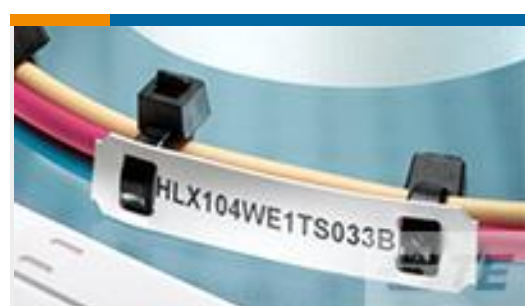
TE 产品编号EC7654-000 HLX203YW1TS050B