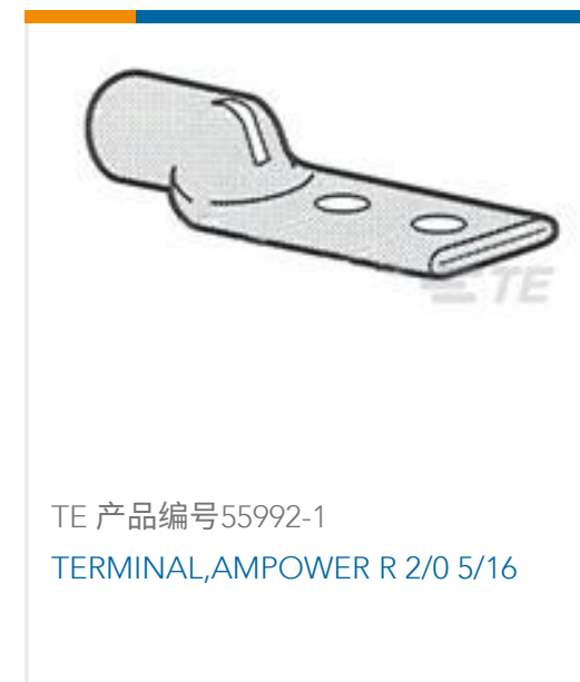
TE 产品编号55992-1 TERMINAL,AMPOWER R 2/0 5/16