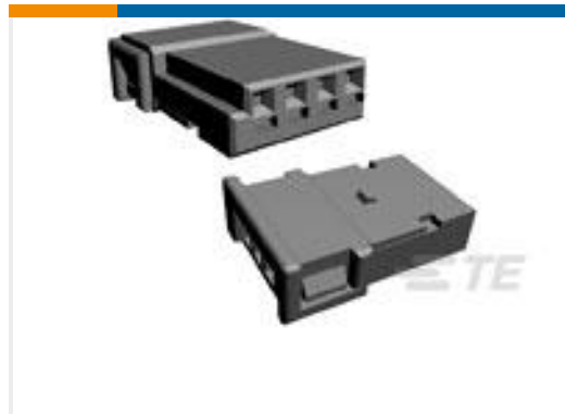
TE 产品编号1241634-1 4POS MQS REC COD Z