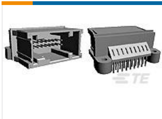
TE 产品编号1-963539-1 18pos MQS .63 header 90deg