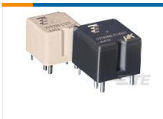
TE 产品编号1393280-6 V23086C1001A403