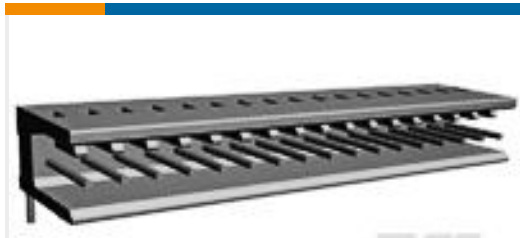
TE 产品编号826468-3 3P MOD II SHROUDED HEADER, RT ANG.