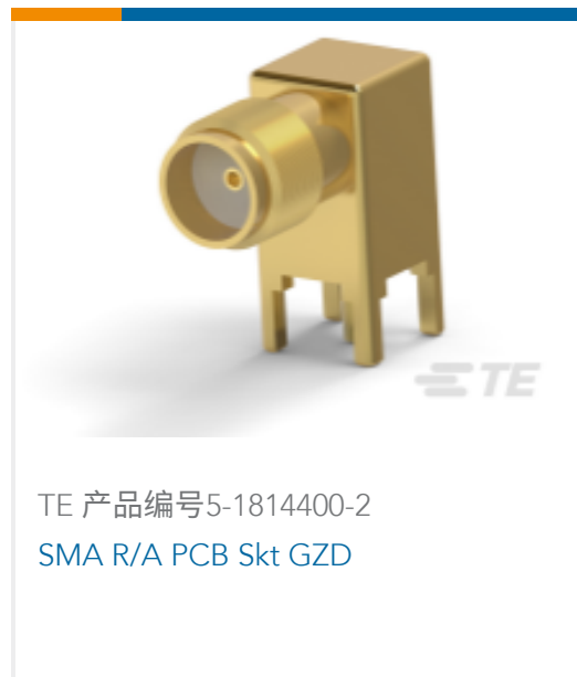
TE 产品编号5-1814400-2 SMA R/A PCB Skt GZD