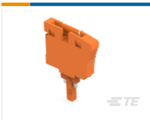
TE 产品编号1SNK900402R0000 PG5-R1