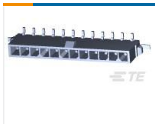
TE 产品编号3-1445053-2 MICRO MNL HDR ASSY S/ROW LF