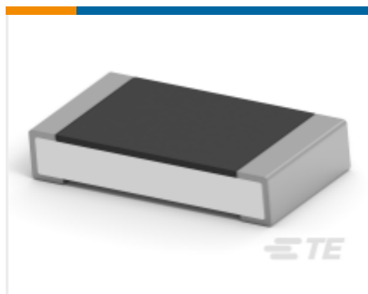
TE 产品编号4-2176390-0 RQ 1206 2K94 0.1% 10PPM 5K RL