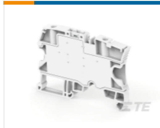
TE 产品编号1SNK506313R0000 ZS4-SP-R1