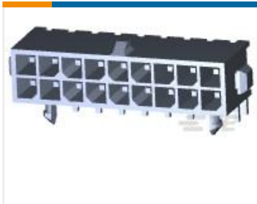
TE 产品编号4-794619-8 18P MICRO MNL ASSY,R/A,HDR LF