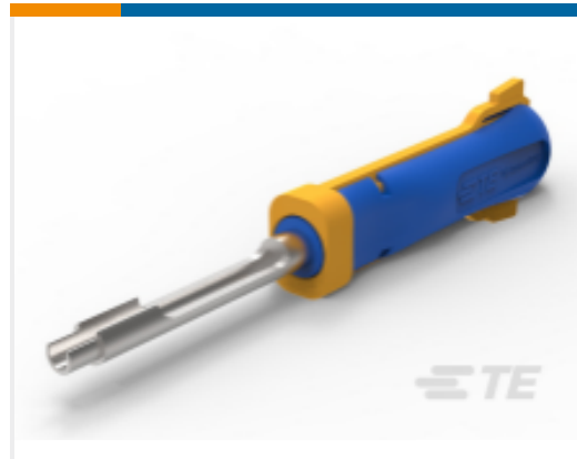
TE 产品编号1338905-1 EXTRACTION TOOL, 5 ROW