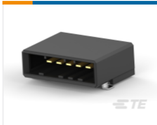
TE 产品编号1-2343327-2 D3100 HDR,5POS SINGLE ROW SMT HORIZONTAL