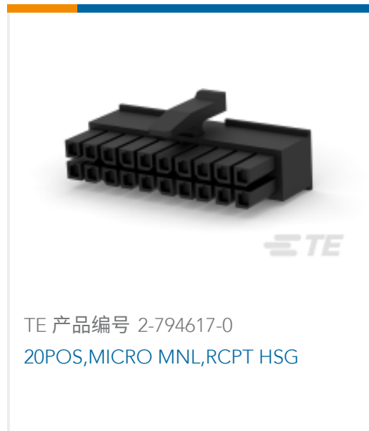
TE 产品编号 2-794617-0 20POS,MICRO MNL,RCPT HSG