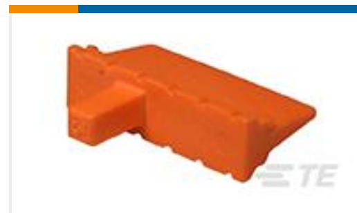
TE 产品编号WM-12P WEDGE LOCK, 12P, REC, ORG, DTM