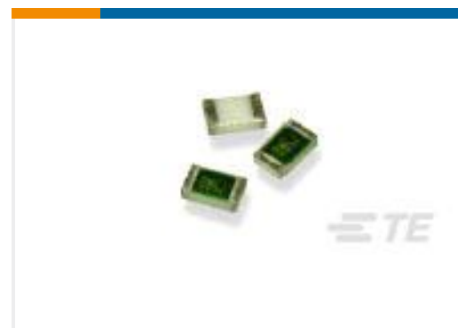
TE 产品编号3-1879212-7 CPF 0402 49K9 0.1% 25PPM 5K RL