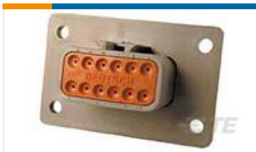
TE 产品编号DTM04-12PA-L012 REC, 12P, GRY, N, FLANGE, A