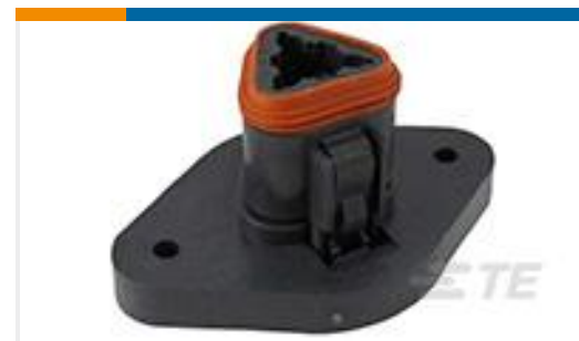
TE 产品编号DT06-3S-CL08 PLG, 3P, BLK, E, FLANGE CAP