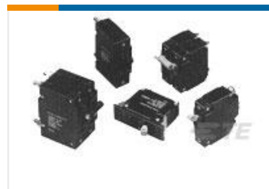
TE 产品编号5-1393252-5 W67-X2Q12-10=M6/M7/M9/W6/W7