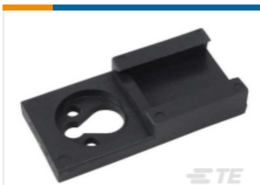
TE 产品编号1011-030-0205 CLIP, PA66, BLK, T-STUD, ST