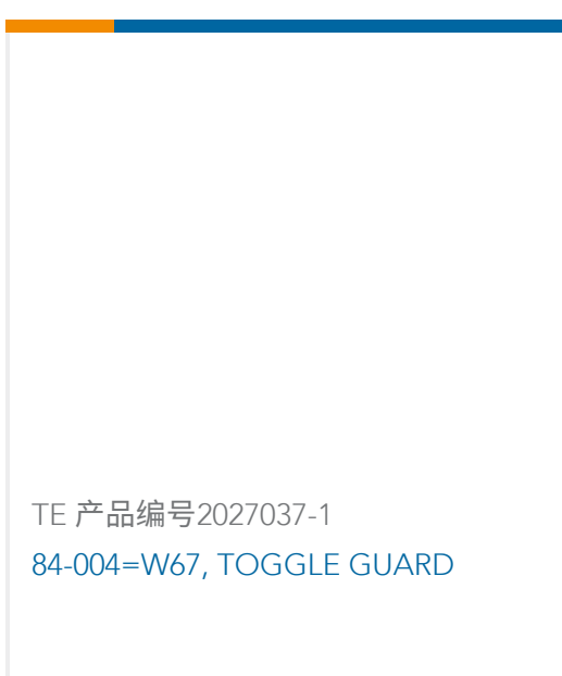
TE 产品编号2027037-1 84-004=W67, TOGGLE GUARD