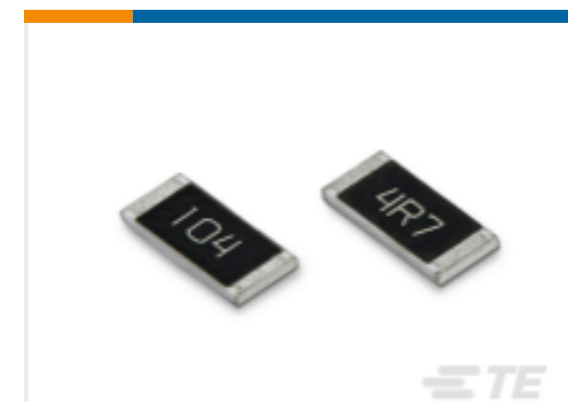
TE 产品编号6-2176455-0 CPF 0402 453K 0.1% 25ppm 1K RL